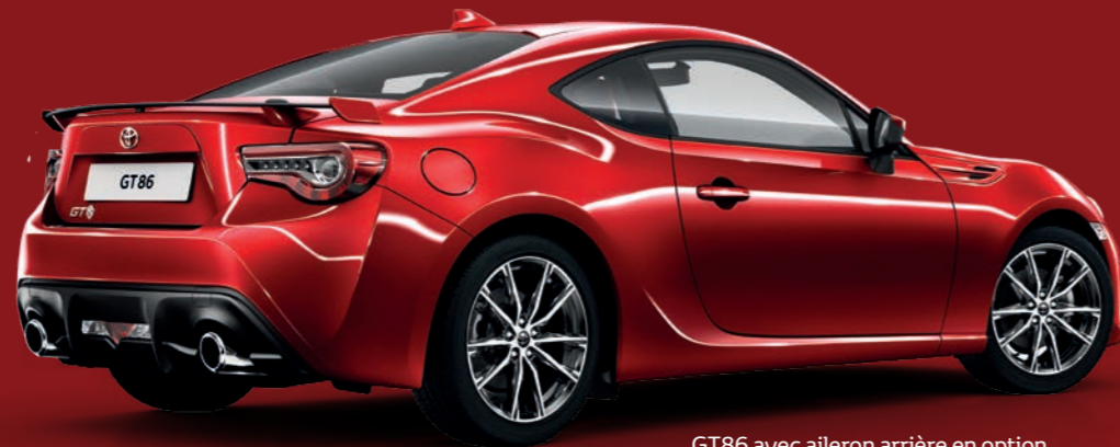
GT86 avec aileron arrière en option.