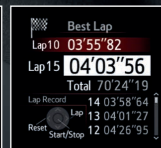
Temps au tour sur circuit.