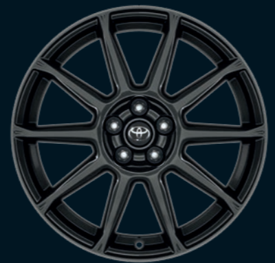
Jantes 10 branches Racing en alliage noir 17" (disponibles en accessoires)

Écrous antivol. Leur profil arrondi et une clé spécifique pour les déverrouiller garantissent une sécurité optimale contre le vol de vos roues.