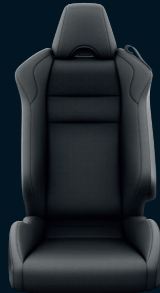
Sellerie tissu avec surpiqûres grises