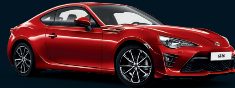
Rouge Pur (M7V)