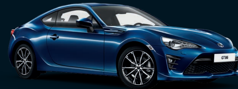
Bleu Perle métallisé* (K3X)