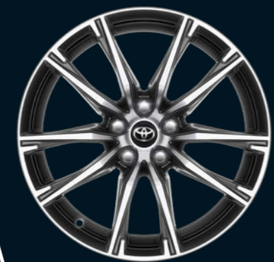
Jantes 10 branches en alliage biton 17"