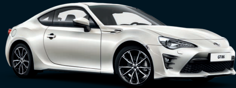
Blanc Nacré* (K1X)

DES COULEURS INTENSES METTENT EN VALEUR LES LIGNES SPORTIVES DU COUPÉ GT86. QUELLE EST LA VÔTRE ?