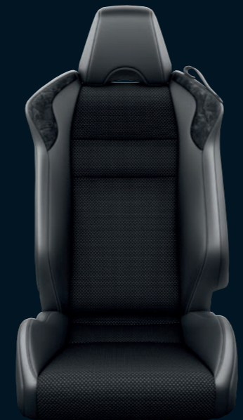
Sellerie en cuir / Alcantara® avec surpiqûres grises (en option)