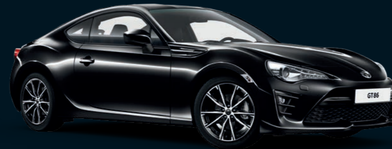
Noir Intense métallisé* (D4S)