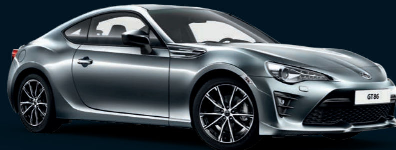
Gris Lunaire métallisé* (G1U)