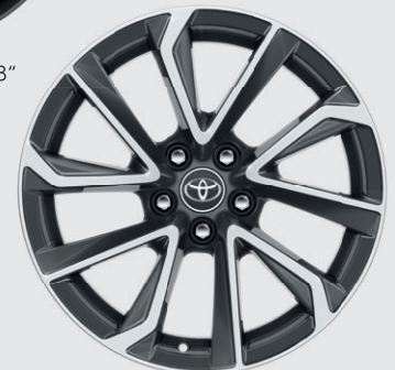
JANTE ALLIAGE 18" COLLECTION