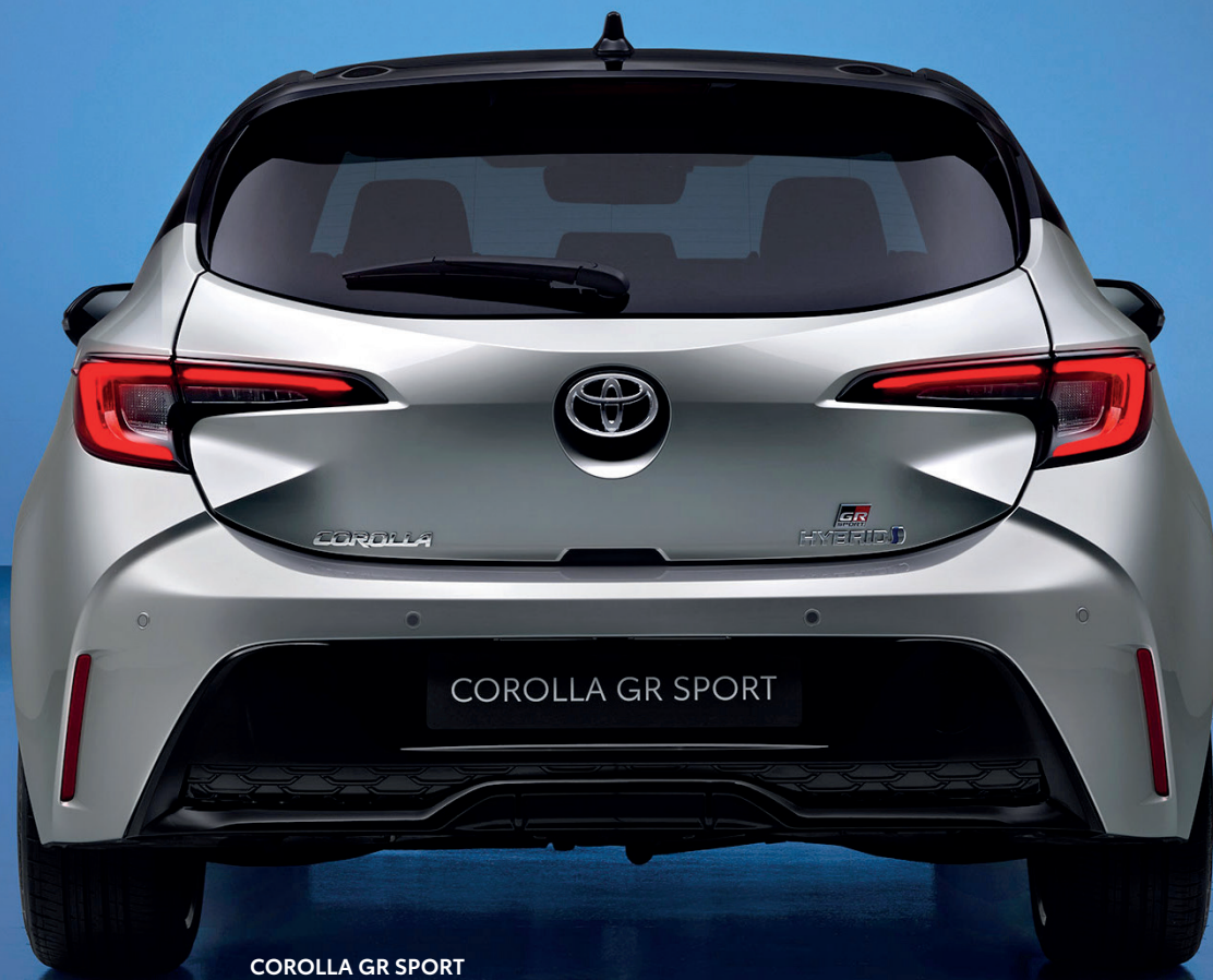
COROLLA GR SPORT 2.0 L Hybride 196 ch / e-CVT avec Pack Techno en option

Pour plus d'informations sur la nouvelle COROLLA, scannez ce code QR avec votre smartphone.