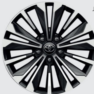
JANTE ALLIAGE 17" DESIGN