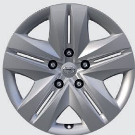
JANTE EN ACIER 16" AVEC ENJOLIVEURS ACTIVE