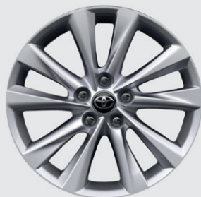
JANTE ALLIAGE 16" DYNAMIC DYNAMIC BUSINESS