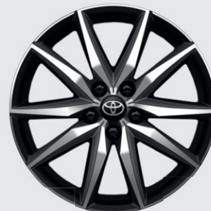
JANTES ALLIAGE 18" 10 BRANCHES GR SPORT