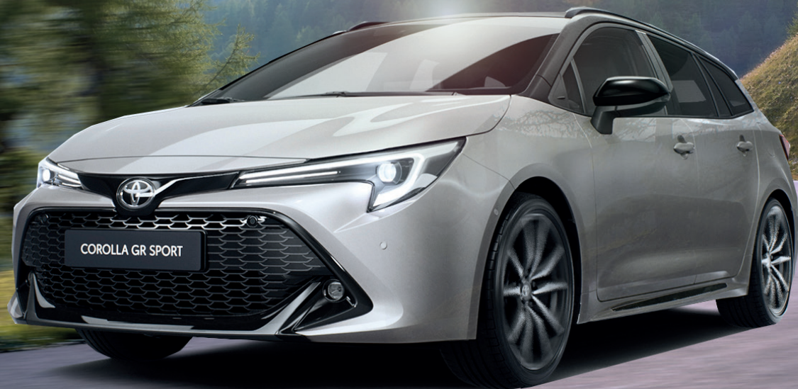
COROLLA TOURING SPORTS GR SPORT 2.0 L Hybride 196 ch / e-CVT avec Pack Techno en option