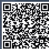
COROLLA TOURING SPORTS

Importateur Distributeur exclusif Toyota France - 20, boulevard de la République - 92420 Vaucresson - Tél. : 01 47 10 81 00 - Société par Actions Simplifiée au capital de 2 123 127 Euros - 712 034 040 R.C.S. Nanterre - Siret 712 034 040 00 154. Les caractéristiques et équipements des modèles présentés dans cette brochure sont donnés à titre indicatif. Les spécifications (poids et dimensions) peuvent varier selon l'évolution des produits. Toyota France se réserve le droit de les modifier sans préavis. Les techniques d'impression peuvent modifier légèrement les couleurs réelles des carrosseries (Photos non contractuelles). Imprimé en France, sur du papier issu de forêts gérées durablement et de sources contrôlées. © Toyota RCS Nanterre : 712 034 040 - Agence IROISE : RCS Paris B 998 610 810 Réf. BROCOR11/22 - Toute reproduction interdite.