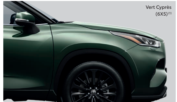
Vert Cyprès (6X5) (1)