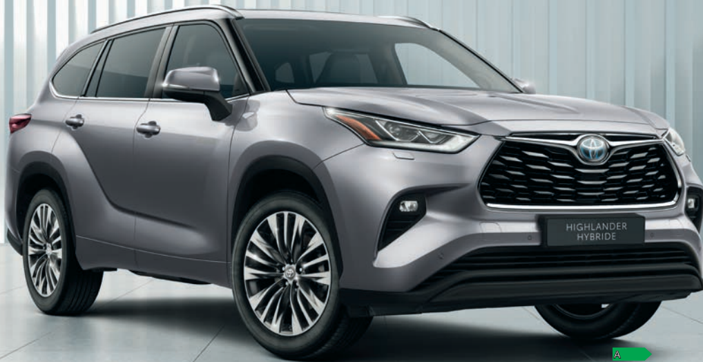
Highlander Hybride Design Business 248 ch AWD-i