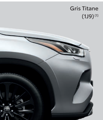
Gris Titane (1J9) (1)