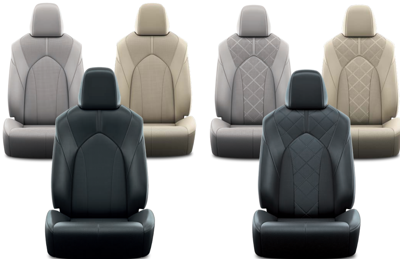
SELLERIE CUIR PERFORÉ NOIR, GRIS OU BEIGE AVEC MOTIF PIQUÉ DESIGN BUSINESS