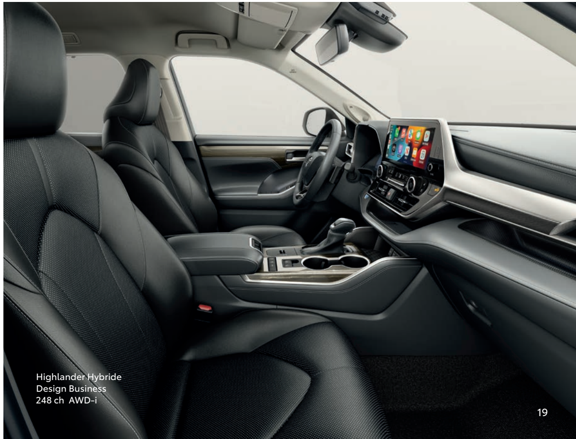
Highlander Hybride Design Business 248 ch AWD-i