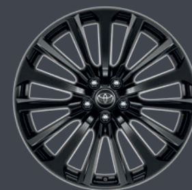
JANTES EN ALLIAGE 20" ARIZONA LOUNGE