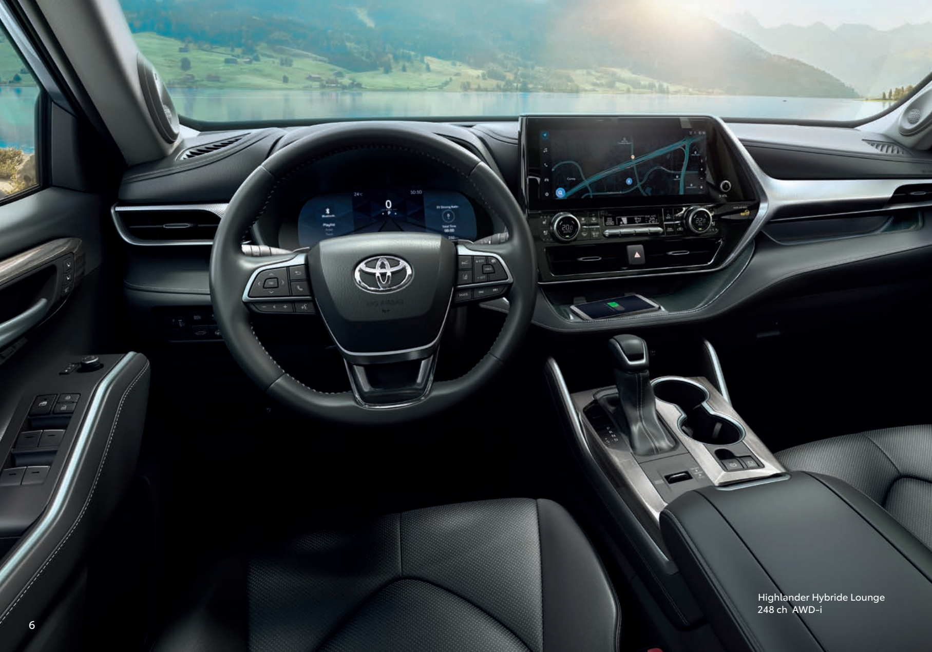
Highlander Hybride Lounge 248 ch AWD-i