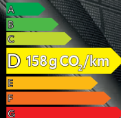
Highlander Hybride Lounge 248 ch AWD-i avec option toit panoramique ouvrant électriquement