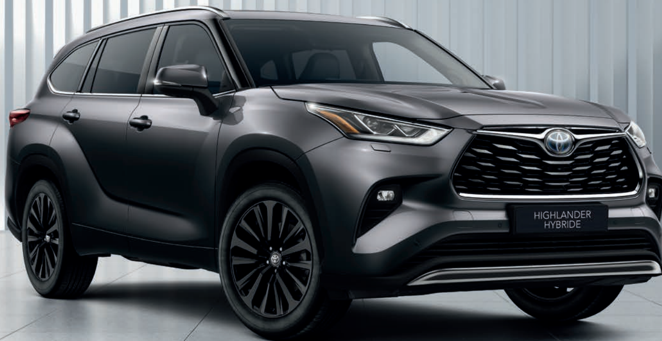
Highlander Hybride Lounge 248 ch AWD-i