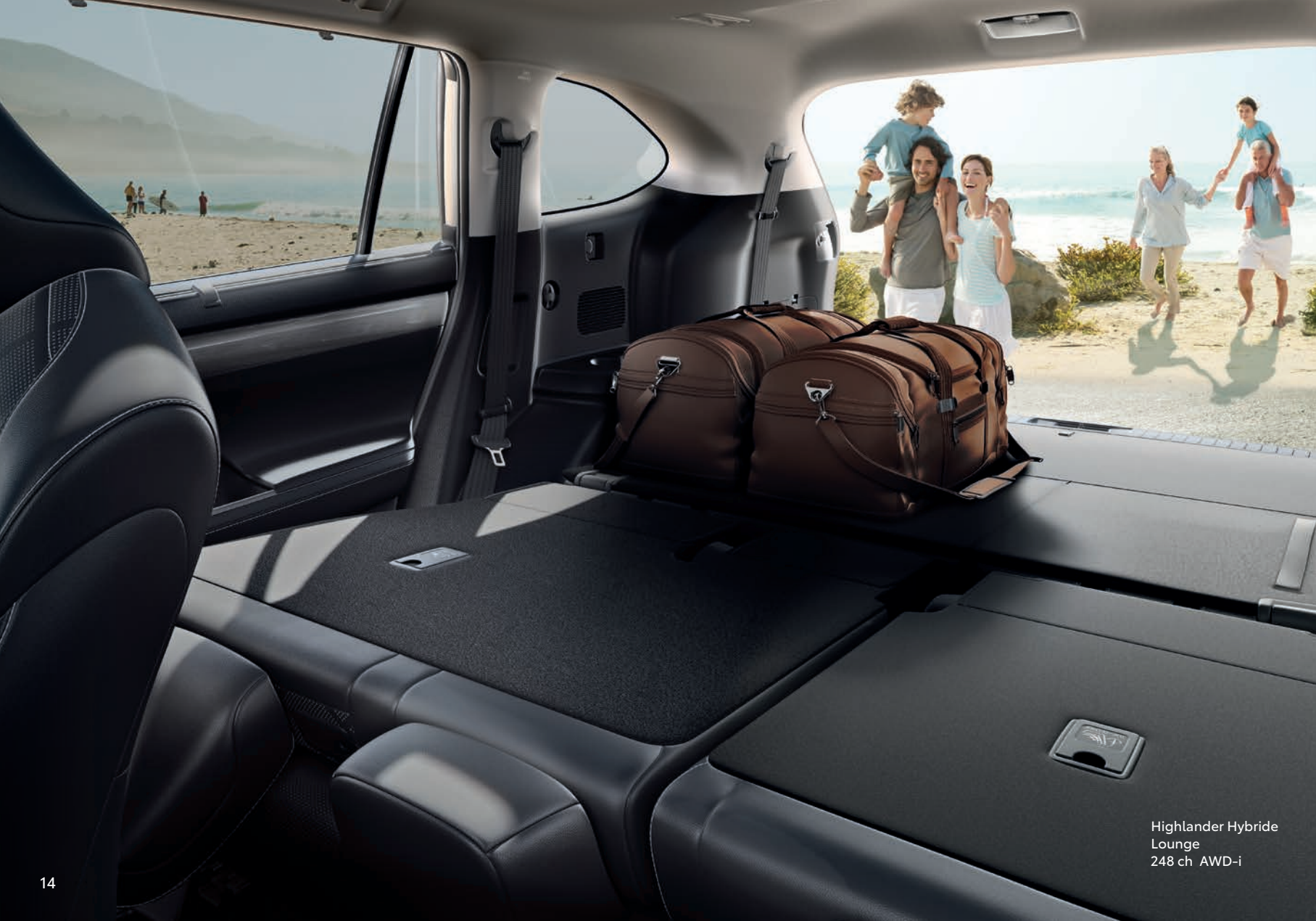
Highlander Hybride Lounge 248 ch AWD-i