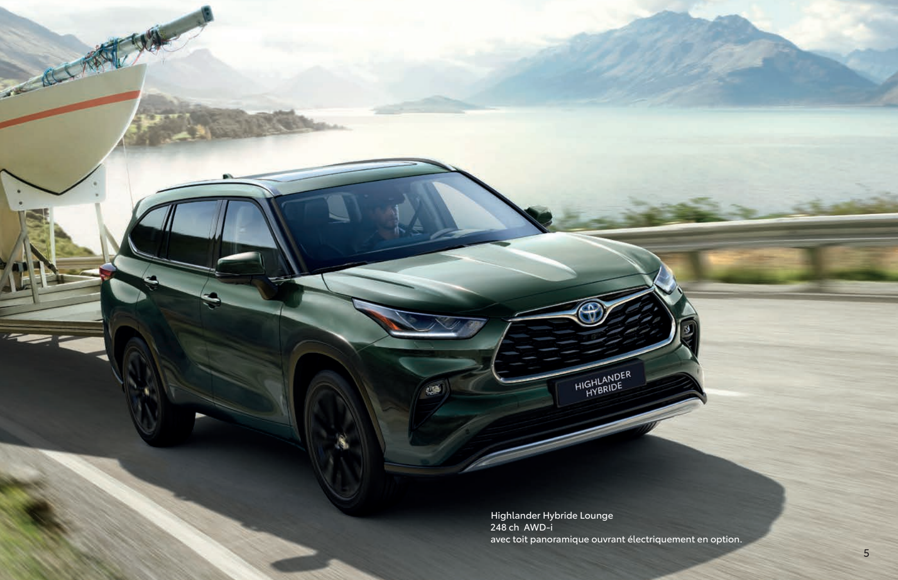
Highlander Hybride Lounge 248 ch AWD-i avec toit panoramique ouvrant électriquement en option.