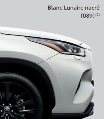
Blanc Lunaire nacré (089) (2)