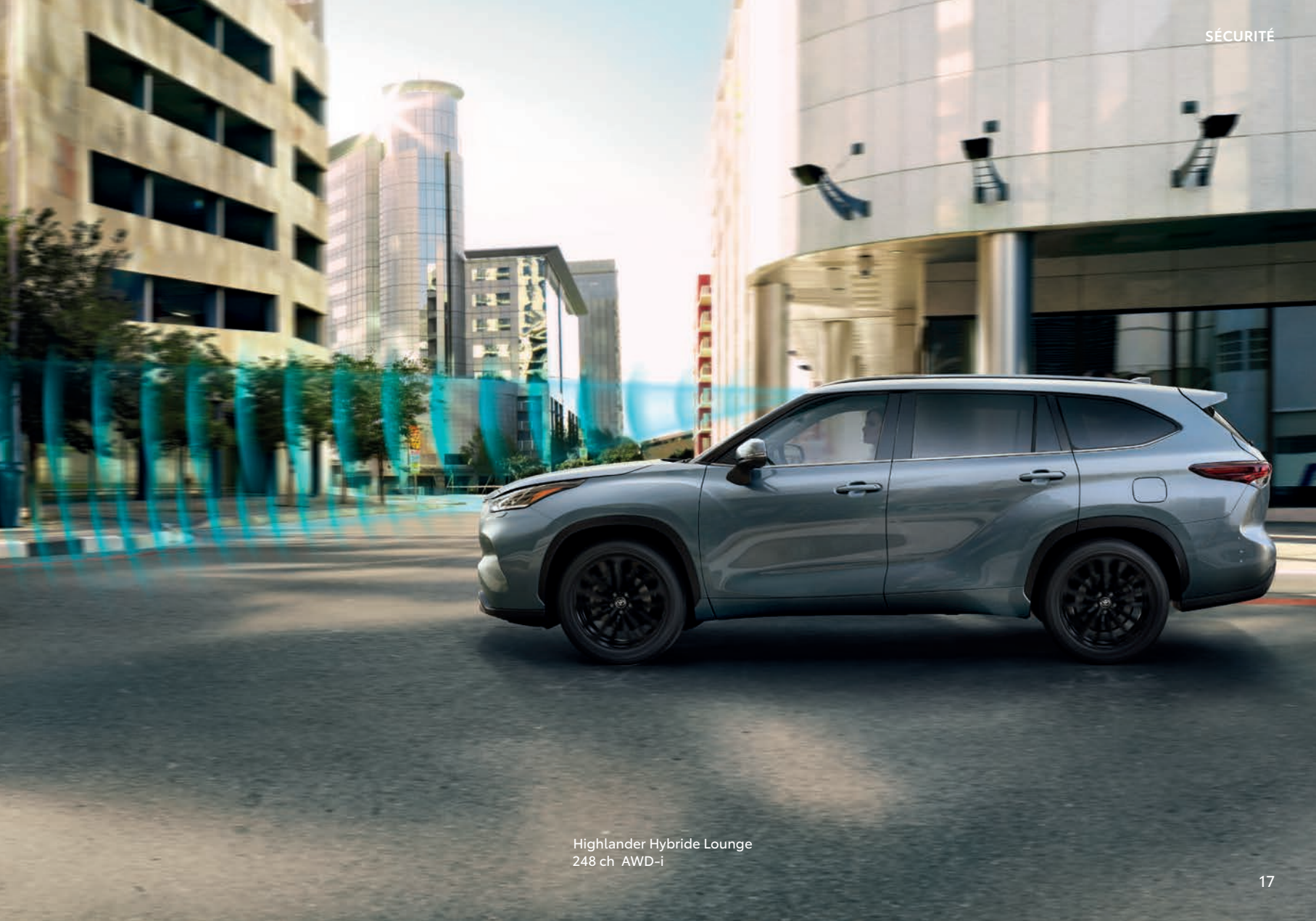
Highlander Hybride Lounge 248 ch AWD-i