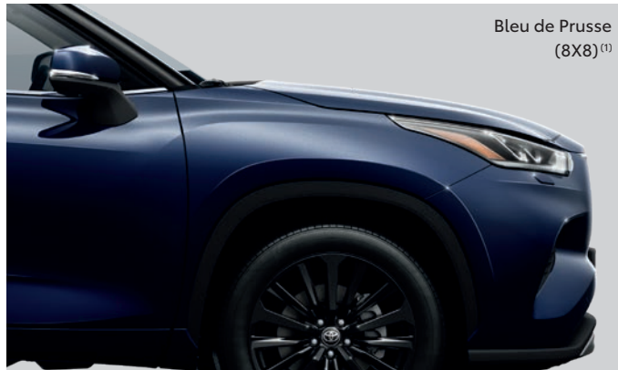
Bleu de Prusse (8X8) (1)