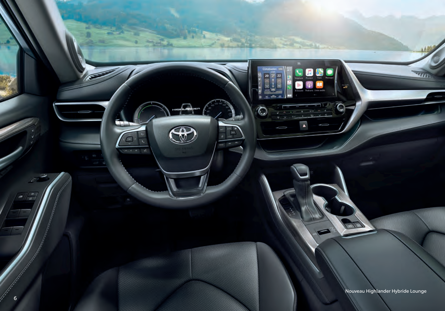
Nouveau Highlander Hybride Lounge