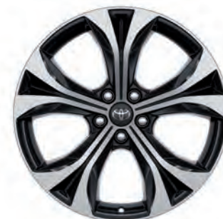
JANTES EN ALLIAGE 20"