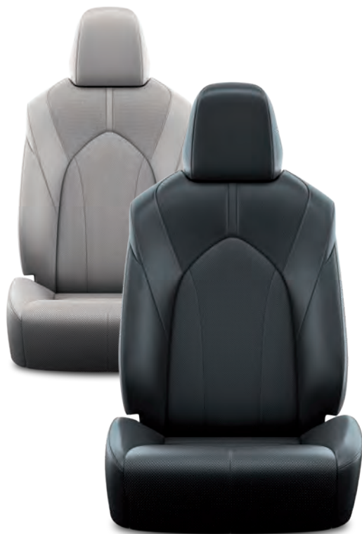
SELLERIE CUIR PERFORÉ NOIR OU GRIS AVEC MOTIF PIQUÉ DESIGN BUSINESS