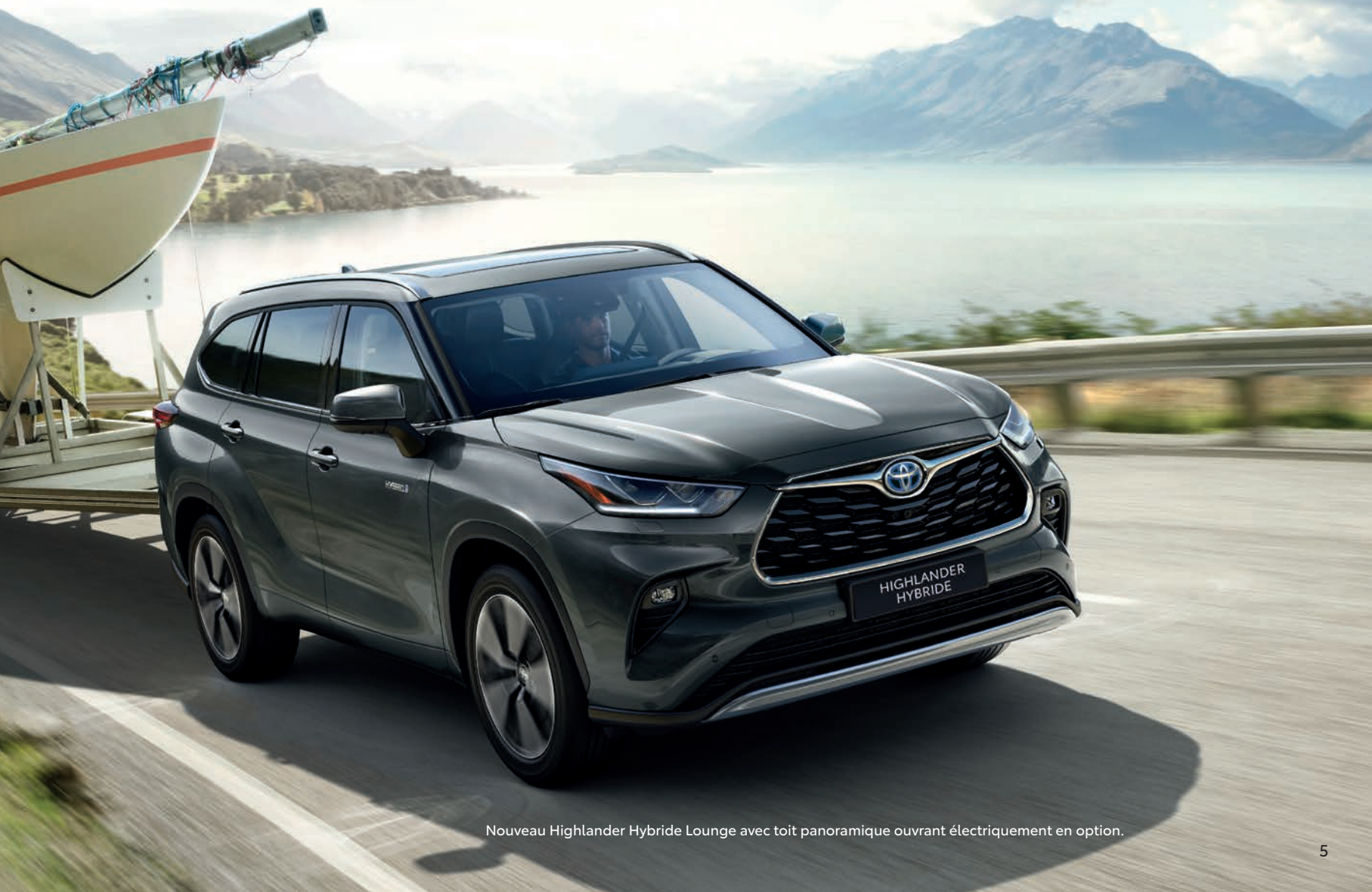
Nouveau Highlander Hybride Lounge avec toit panoramique ouvrant électriquement en option.