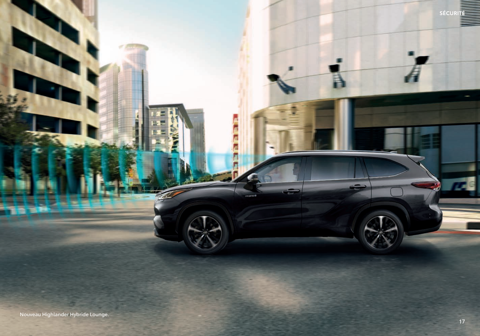
Nouveau Highlander Hybride Lounge.