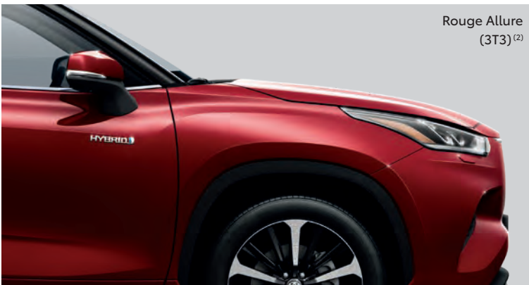
Rouge Allure (3T3) (2)