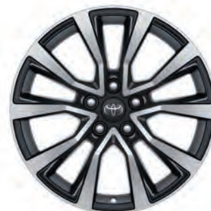
JANTES EN ALLIAGE 18"

En plastique antidérapant avec bords surélevés, il stabilise la position de vos bagages, tout en protégeant la moquette de votre coffre.