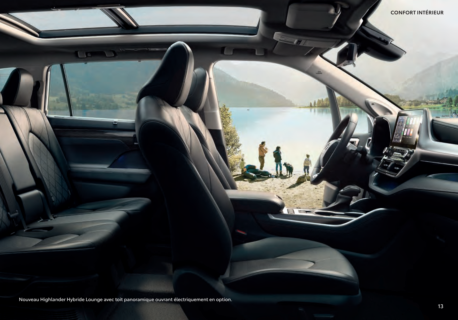
Nouveau Highlander Hybride Lounge avec toit panoramique ouvrant électriquement en option.