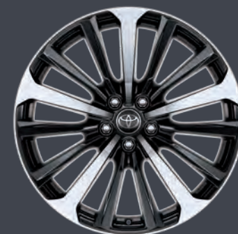
JANTES EN ALLIAGE 20" DAKOTA LOUNGE