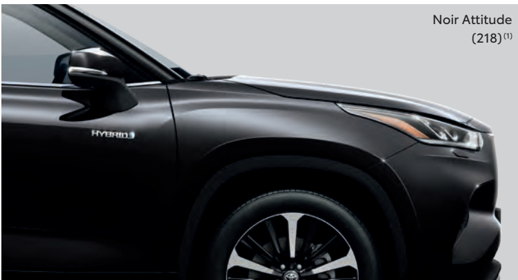
Noir Attitude (218) (1)