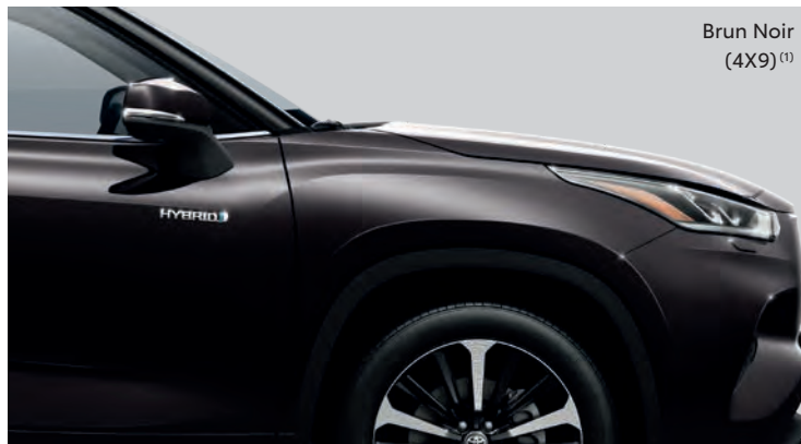
Brun Noir (4X9) (1)