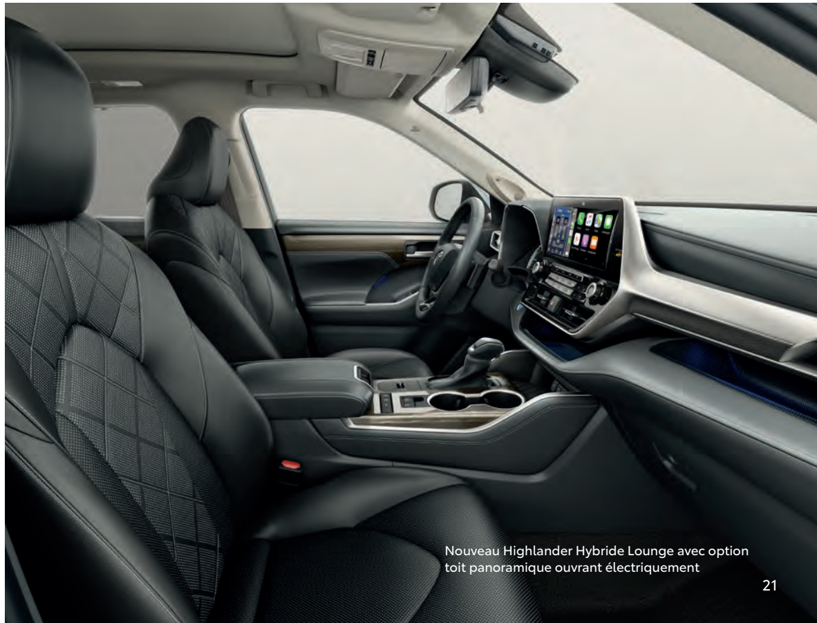
Nouveau Highlander Hybride Lounge avec option toit panoramique ouvrant électriquement