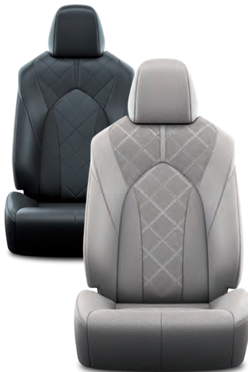
SELLERIE CUIR PERFORÉ NOIR OU GRIS AVEC MOTIF EN LOSANGE LOUNGE