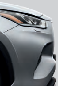
Gris Titane (1J9) (1)