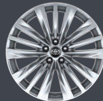
JANTES EN ALLIAGE 20" INDIANA DESIGN BUSINESS