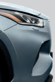
Bleu Horizon (1K5) (2)